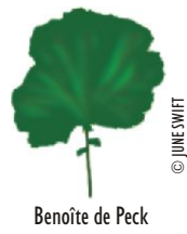
Benoîte de Peck

Cinq autres espèces de benoîtes poussent en Nouvelle-Écosse, habituellement à l'ombre dans des basses terres, le long de ruisseaux et de rivières, mais pas dans des tourbières découvertes.