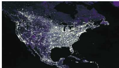
L'Amérique du Nord durant la nuit