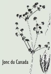
Jonc du Canada

Jonc du Canada ( Juncus canadensis ) : Commun et très similaire au jonc du New Jersey; feuilles et tiges lisses; bouquets de fleurs et grappes de fruits plus denses.