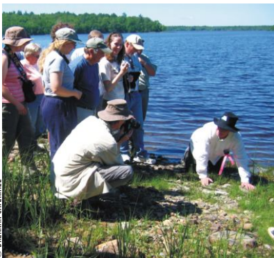
Fleurs de la lachnanthe de Caroline