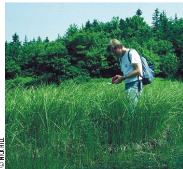
Domages causés par des VTT le long d'un sentier