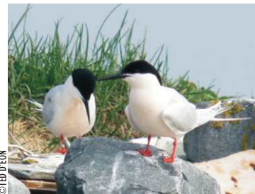
Oisillon de la sterne de Dougall