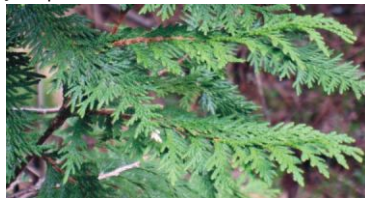
Branches de thuya occidental