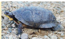
© JEFFE MCNEIL © MARK PULSIFER

Taille similaire (de 20 à 25 cm de long); carapace lisse et fortement bombée; menton et gorge jaune vif; face souriante; carapace mouchetée de jaune