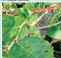
Veilles et jeunes brindilles