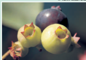
Fruits noirs et mûrs, et verts et point mûrs