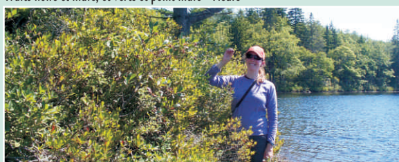
Un bleuetier en corymbe plus haut que Megan