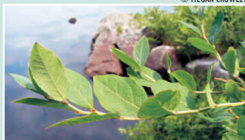
Feuilles en forme ovale

© MEGAN CROWLEY © MEGAN CROWLEY © MEGAN CROWLEY