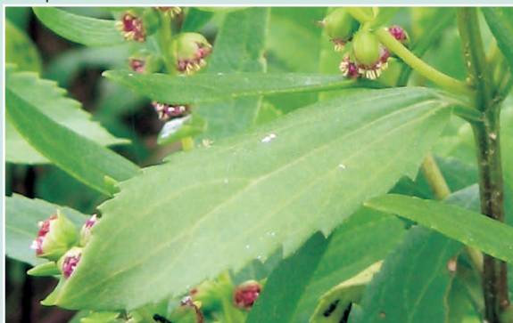
Feuille dentée et en forme de lance