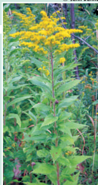
La verge d'or rugueuse

Espèces semblables : 15 espèces du genre Solidago se trouvent en Nouvelle-Écosse, y compris quelques-unes qui sont très semblables à la verge d'or d'Elliott. La verge d'or rugueuse ( Solidago rugosa ) ressemble le plus à la verge d'or d'Elliott, sauf qu'elle est plus répandue géographiquement, elle a une tige couverte de poils et elle a tendance à pousser lorsque c'est plus sec. La verge d'or du Canada ( Solidago canadensis ) et la verge d'or géante ( Solidago gigantea ) ont des feuilles en haut de la tige qui sont plus étroites (<1,4 cm de large) et avec trois veines.