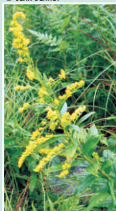
Regroupement de fleurs