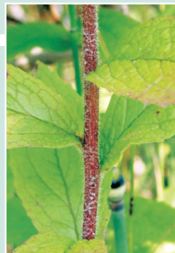
Tige de la verge d'or rugueuse