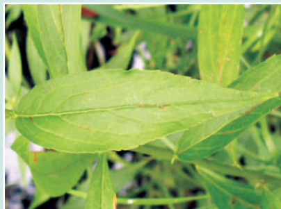
Feuille © SEAN BLANEY