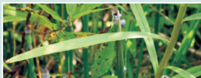
Feuilles de la verge d'or à feuilles de graminée