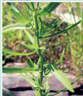
Feuilles linéaires, en biais sur la tige