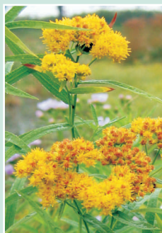
Fleurs de la verge d'or à feuilles de graminée

Espèces semblables : La verge d'or à feuilles de graminée ( Euthamia graminifolia ) est commune dans une grande variété d'habitats à travers de la Nouvelle-Écosse. Elle a un regroupement de fleurs de 5 à 20 cm de large et ses feuilles sont plus larges (3 à 12 mm) et ont distinctement trois veines.