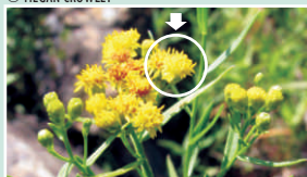
Regroupement de fleurs, avec une petite fleur encerclée