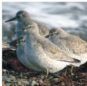
Plumage d'un juvénile