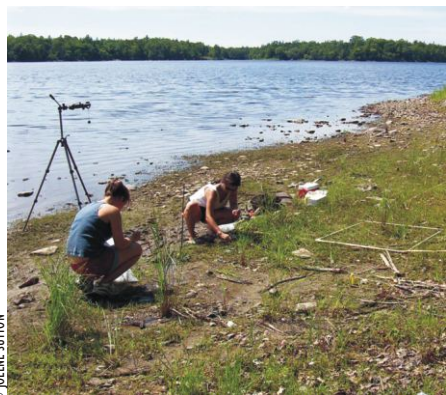
Recherche sur le terrain